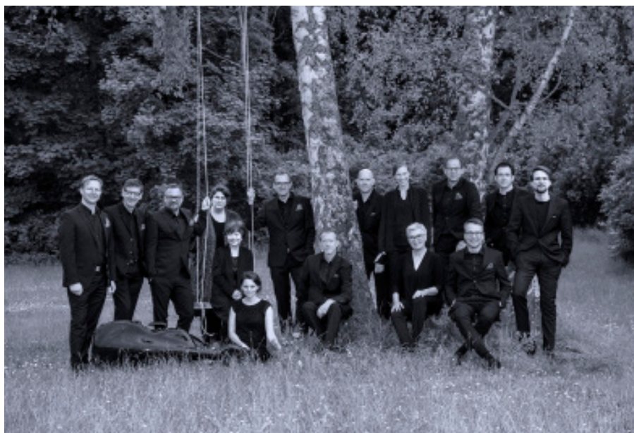
ensemble KONTRASTE

Das Rückgrat des eK-Programms: KONTRASTE – Klassik in der Tafelhalle. Ein großer Abonnentenstamm schätzt das Angebot: Konzerte, Bühnen-, (Stumm-)Film- oder Videoproduktionen, das Familienkonzert und nicht zuletzt das florierende Dichtercafé mit seiner Mischung aus Lesung und Musik.